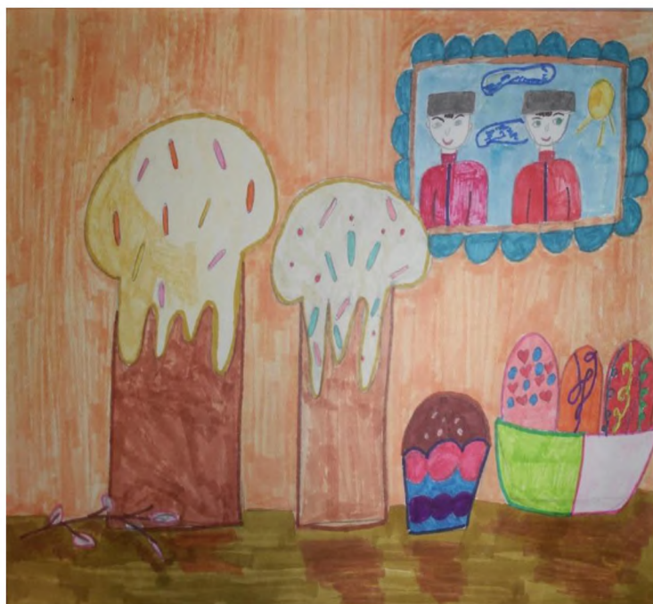
Рис. 3 «Пасха в кубанской семье»

Традиционным является участие детей в конкурсе «Пасха в Кубанской семье», с каждым ребенком проговариваются детали, делающие его работу уникальной, при этом намекающие зрителям о культурной среде, месте и времени создания натюрморта.