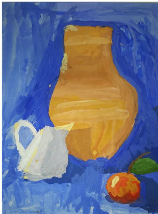
Рис. 6 «Натюрморт с кринкой» Жиляков Архип, 10 лет

Блок тем «Осенняя ярмарка» позволяет ребятам окунуться в пестрый мир даров осени, изображать с натуры овощи, которые только что трогали руками, гладили по округлым бокам, удивлялись тяжеловесности (рис.7).