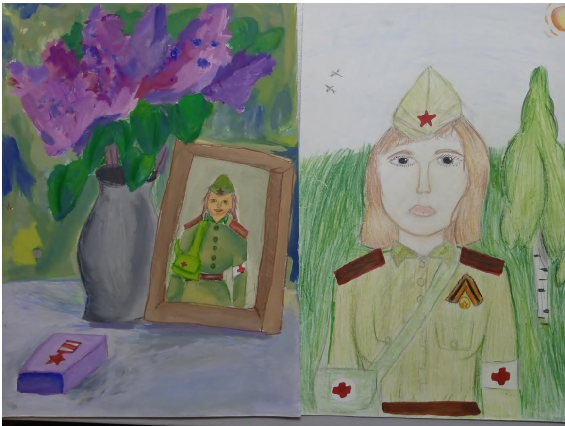
Рис. 4 «Диптих. Победе посвящается» Корнеева Лиза, 10 лет